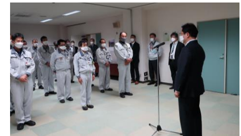
もんじゅ(左)、ふげん(右)での職員への訓示