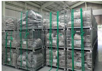
メッシュボックス収納容器の収納状況

(内容) メッシュボックス収納容器の段積み数を3段から4段積みに変更した際、より安全に保管できるような治具等の検討・試作する。